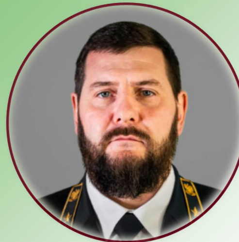
Быстрянец Н. Ю.

Министр природных ресурсов, экологии и рыболовства Херсонской области